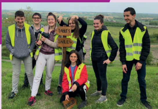
Les jeunes lors du Chantier d'avril à Tourtrès

Matthieu ARCAS, Communauté de communes, 06 45 59 12 83, jeunesse@cclt.fr