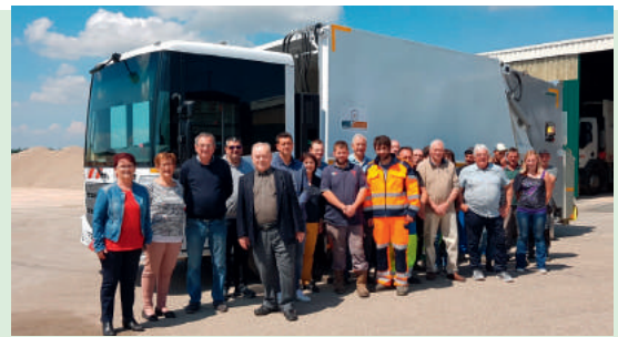
Les maires et les agents devant le nouveau véhicule