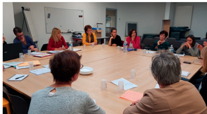
Comité de pilotage du 21 mai 2019 réunissant les professionnels de santé, l'ARS, le Département et la Fédération Nouvelle-Aquitaine des Maisons Pluriprofessionnelles de Santé.

Toutes ces réflexions sont menées avec les professionnels de santé du territoire ainsi que l' ARS , le Département et la Fédération Nouvelle-Aquitaine des Maisons Pluriprofessionnelles de Santé . Un groupe de travail a notamment été créé à cet effet et se lance actuellement dans la réalisation d'un projet de santé territorial . Tous les professionnels de santé souhaitant contribuer à ce projet sont bien évidemment invités à se manifester !