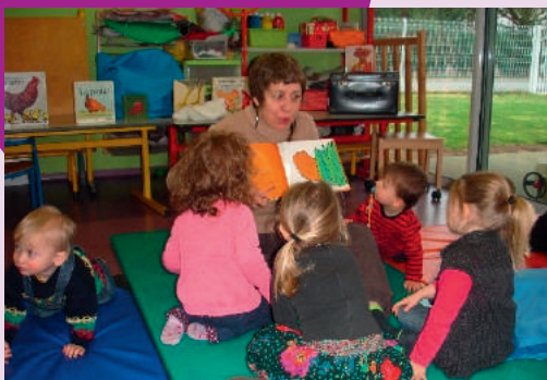
Animations et intervenantes au RAMPE