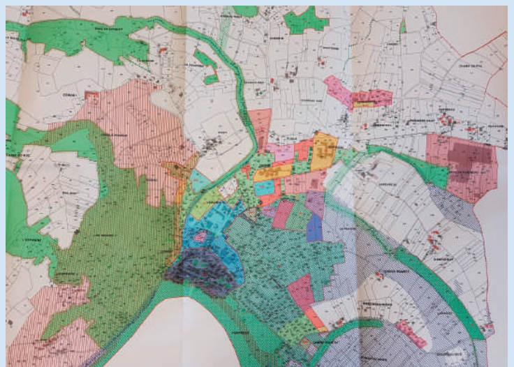
Exemple de document graphique avec le zonage du PLUI

Retrouver toutes les actualités du PLUI sur notre site internet www.lotettolzac.fr , rubrique Urbanisme