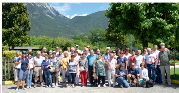
Le comité de jumelage au Val d'Aoste

Pour cette manifestation d'envergure, les élus communautaires ont décidé de verser une subvention exceptionnelle de 1000 € au comité de jumelage.