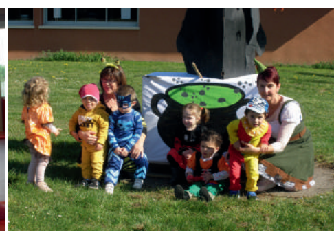
Animations à la crèche Le Nuage Rose