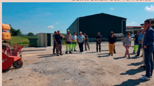
Les élus en visite au dépôt technique à Coullx