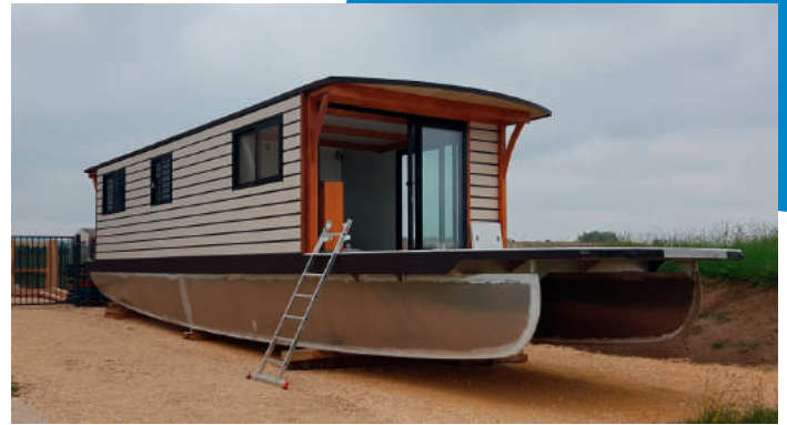
La coche solaire en cours de réalisation sur la ZAE

1.50 € HT/heure, 7 € HT la demi-journée, 12 € HT la journée