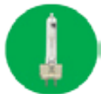
Figure 4 : Lampe à iodure métallique