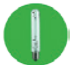
Figure 5 : Lampe sodium haute pression