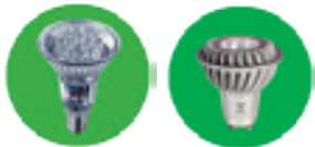
Figure 2 : Lampes à LED