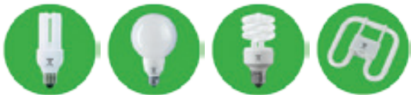
Figure 1 : Lampes fluo-compactes