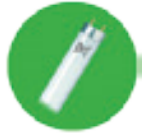
Figure 3 : Tube fluorescent