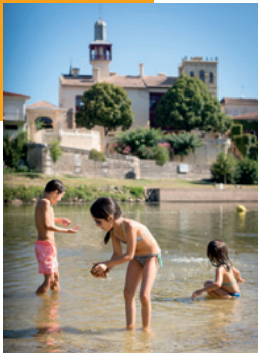
Figure 6 : ©CDT47 - Christian Preleur