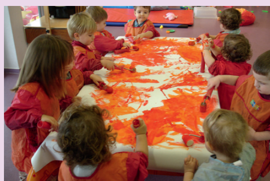
MATINÉE D'ÉVEIL À CASTELMORON SUR LOT