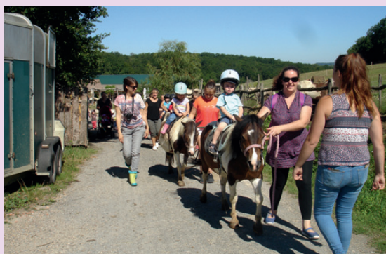
SORTIE DU RAMPE LE 4 JUILLET 2017 AU RANCH DU BEL AIR À LABRETONIE